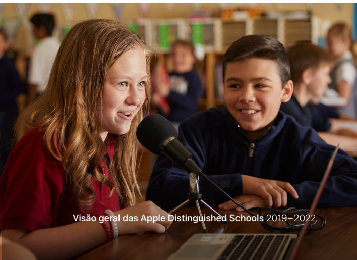
Visão geral das Apple Distinguished Schools 2019–2022

As Apple Distinguished Schools estão dispostas a se envolver em visitas a outras escolas participantes, publicar a história de sucesso da escola e compartilhar as melhores práticas e evidências do sucesso acadêmico dos alunos.